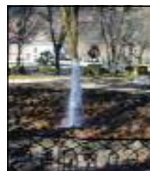
Vals les Bains