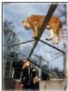
Safari, le tunnel des lionnes