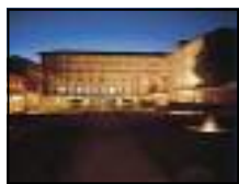
Musée de la chaussure