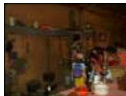
Ferme de Tiallou