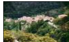
Saint Symphorien de Mahun