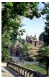
Palais idéal Hauterives