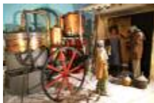
Musée de l'alambic