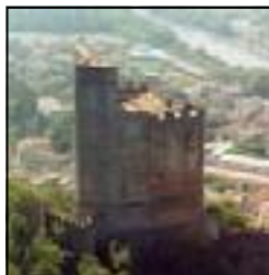
La Tour de Crest